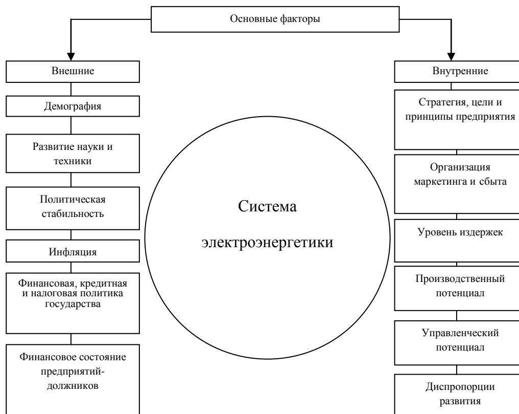
Рис. 1. Воздействие внешних и внутренних факторов на систему электроэнергетики

Негативное влияние внешних и внутренних факторов на экономическую систему нельзя свести к нулю. Экономическая система способна лишь оптимально регулировать силу этого влияния. В разные моменты времени состояние экономической системы различное, поэтому сила воздействия внешних и внутренних факторов и ответная реакция системы на нее не могут быть одинаковыми (Кибиткин, Труничева, 2005).