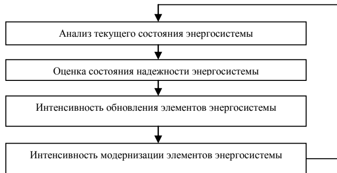
Рис. 4. Блок-схема механизма устойчивого развития ЭЭС

Механизм устойчивого развития энергосистемы включает в себя следующие составляющие: анализ текущего состояния энергосистемы; оценку состояния надежности энергосистемы; интенсивность обновления элементов энергосистемы; интенсивность модернизации элементов энергосистемы (рис. 4).