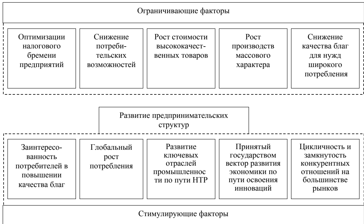
Рис. 1. Факторы, определяющие темпы развития предпринимательских структур

С другой стороны, развитие предпринимательства имеет ряд системообразующих ограничителей роста: общая тенденция к оптимизации налогового бремени предприятий; снижение потребительской возможности к приобретению более качественных, но более дорогих благ; вовлечение на рынок промышленного производства массового характера, с минимальными требованиями к качеству благ и минимальным участием новых технических и управленческих решений (рис. 1).