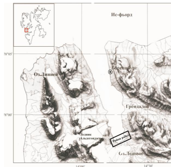
Рис. 1. Район проведения исследований